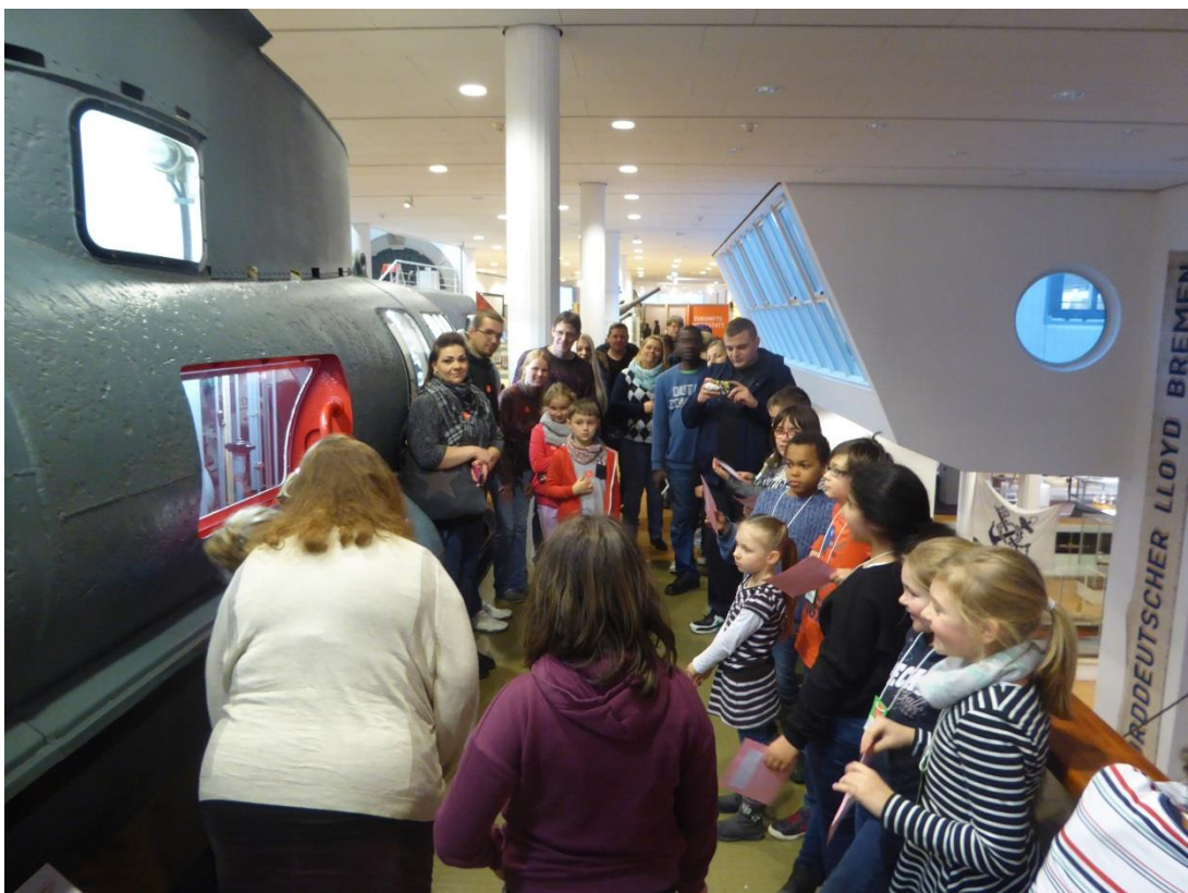
6. Hier berichten die Kinder interessante Fakten über das U-Boot "Seehund"