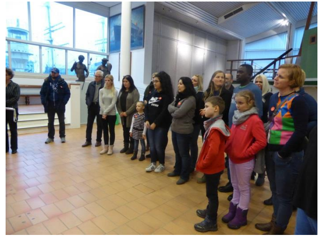
2. Der Vortrag über das Passagierschiff "Bremen 4" wird ganz gespannt verfolgt